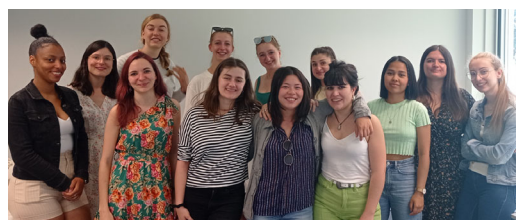
La première promo